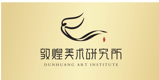
金、银色背景使用方式,品牌色品牌标识可在金、银色背景上呈现