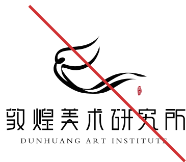
禁止将品牌标识文字随意摆放