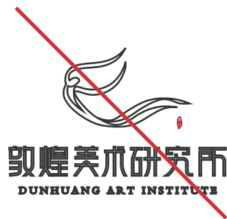
禁止将品牌标识做线稿处理

为了确保正确的呈现我们的品牌标识,切记不要随意更改或者摆放敦煌美术研究所标识中的任何元素。虽然如下的示例不能列举出所有不正确的使用,但说明了一些必须避免的可能错误。