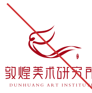
禁止将品牌标识替换颜色