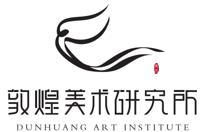
单色品牌标识 (制作工艺应用)