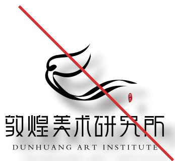
禁止将品牌标识添加投影