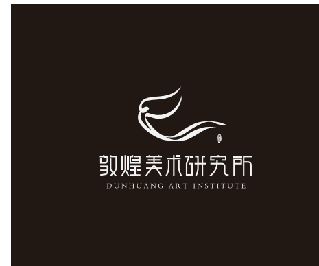
敦煌美术研究所LOGO（标准版）