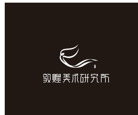
敦煌美术研究所LOGO（简版）