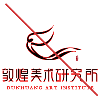
禁止将品牌标识添加描边