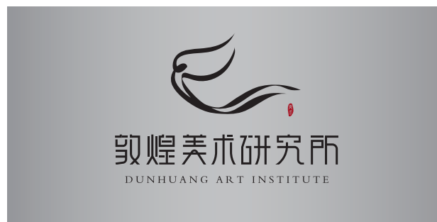
金、银色背景使用方式,反白色品牌标识可在金、银色背景上呈现