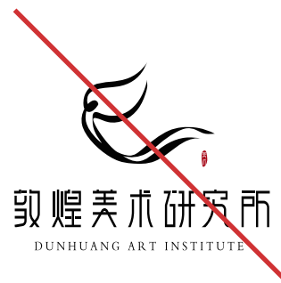
禁止将品牌标识变形