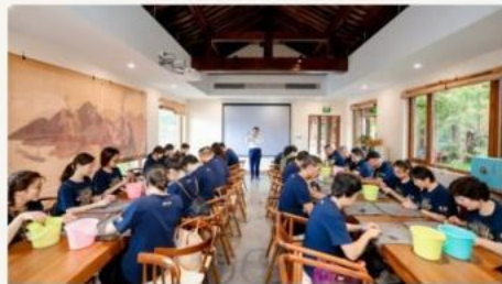
良渚艺创园 5000+ m 2