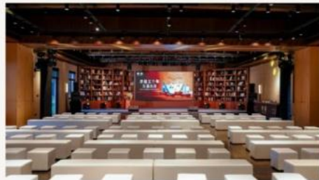
遗址公园 · 国际研学中心