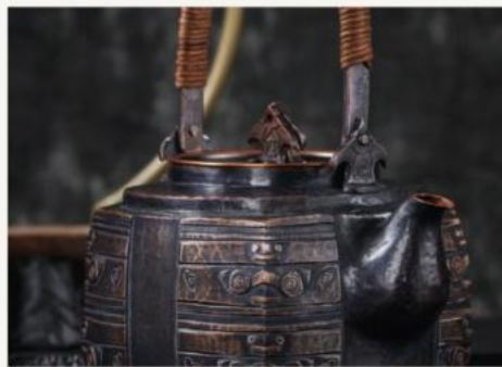
— 铁壶 · 琮纹