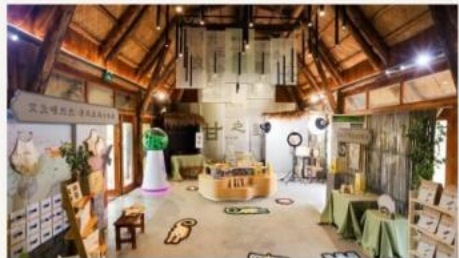
良渚博物院 · 多功能厅