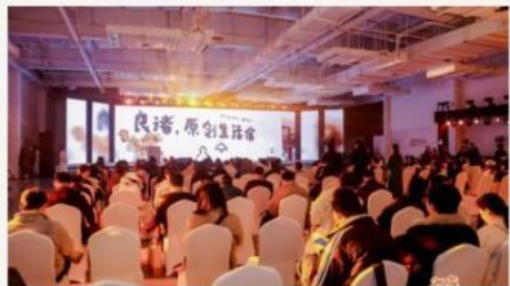
遗址公园 · 雉山茶室