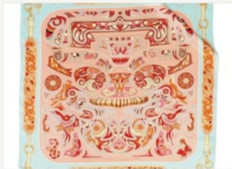
— 丝巾 · 神纹