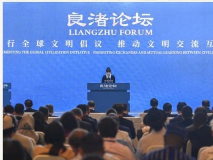
良渚论坛 · 主舞台