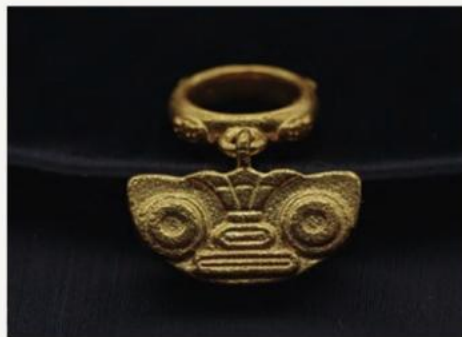
— 金饰 · 戒指