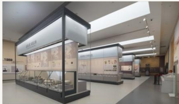
良渚博物院 · 展厅内景