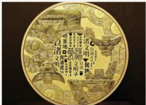
— 金饰 · 神人兽面