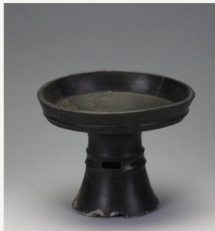
黑陶豆 线条的克制