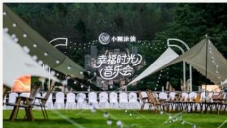
遗址公园 · 党群服务中心