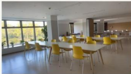
遗址公园 · 反山生活馆