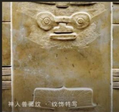
神人兽面纹 · 纹饰特写