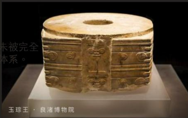
玉琮王 · 良渚博物院