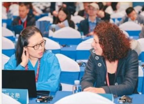
良渚论坛 · 全球嘉宾

论坛每年形成稳定的文化议题与传播内容。品牌可通过主题共创、联合活动、艺术展陈等方式参与其中，成为文化趋势的共建者与传播者。