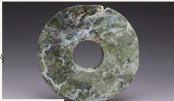
玉璧 · 礼天之器