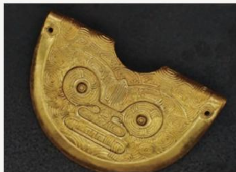
— 金饰 · 璜形佩