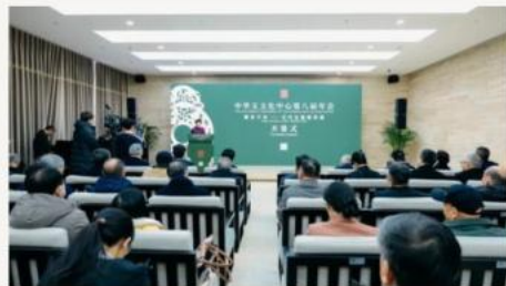
良渚博物院 · 晓风文创空间